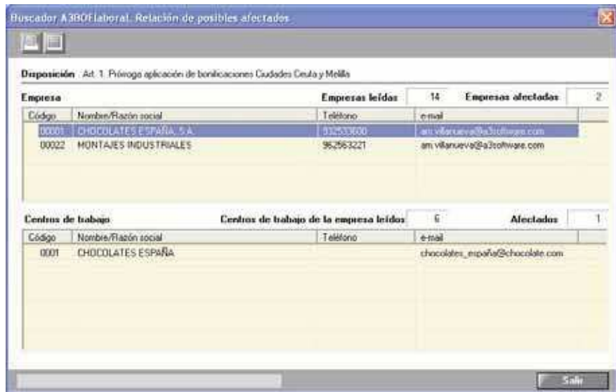
La aplicación identifica los clientes afectados por la disposición publicada